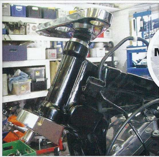
Montering af gaffel